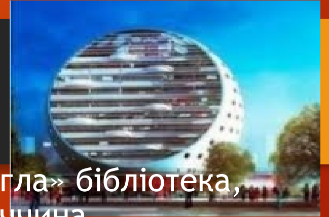
«Кругла» бібліотека, Німеччина

На місці легендарної Олександрійської бібліотеки, знищеної біля 2000 років тому, була збудована Бібліотека Олександрина. Спадкоємиця бібліотеки Олександра Македонського відкрила двері перед читачами у 2002 р. Споруда розташовується посеред басейну і має форму диску, символізуючи, одночасно, і схід Сонця Знань і древньоєгипетського бога сонця Ра.