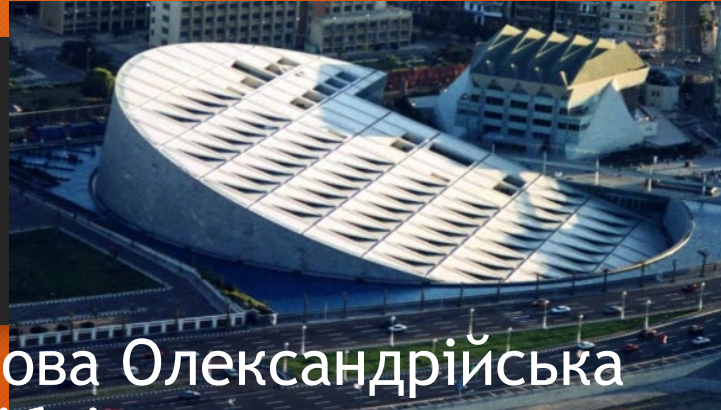
Нова Олександрійська бібліотека

Споруда бібліотеки виконана у формі літаючої тарілки з прозорими рожевими стінами. Футуристичний інтер'єр, грамотне поєднання природного та штучного освітлення, продумана звукоізоляція читальних залів, а також цілодобова робота бібліотеки - все це приваблює читачів будь-якого віку