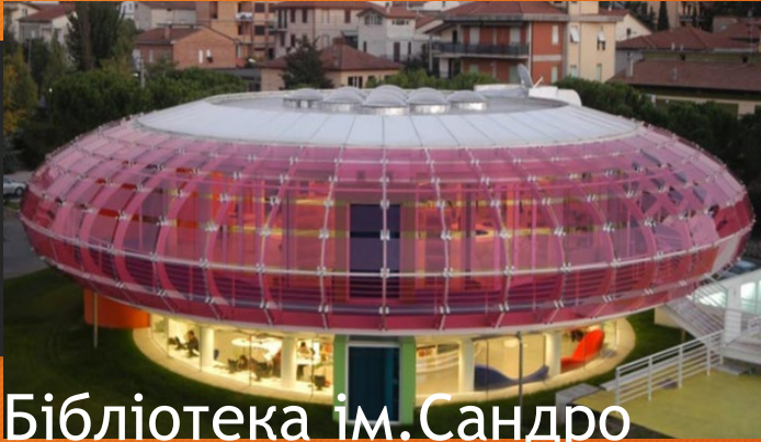
Бібліотека ім. Сандро Пенни, Італія

Споруда бібліотеки виконана у формі літаючої тарілки з прозорими рожевими стінами. Футуристичний інтер'єр, грамотне поєднання природного та штучного освітлення, продумана звукоізоляція читальних залів, а також цілодобова робота бібліотеки - все це приваблює читачів будь-якого віку